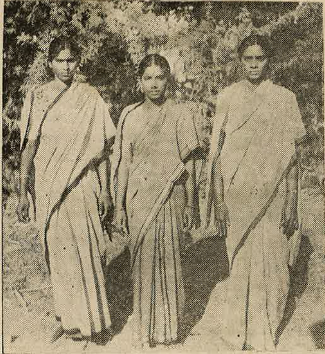
భగవద్గీత బుర్రకథ దశం